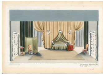
Un chapeau de paille d'Italie Acte IV